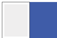
обложка, 1/1 полосы