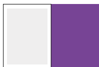
1/1 полосы, обложки