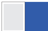
обложка, 1/1 полосы