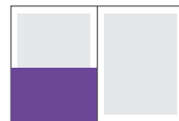
1/2 (2 обложка)