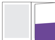
1/2 (3 обложка)